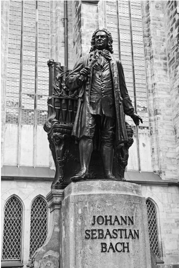
Bach-Denkmal vor der Thomaskirche in Leipzig.