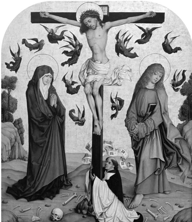
Christus am Kreuz zwischen Maria und Johannes, Holztafel, um oder kurz nach 1491. Meister des Monis-Altars (tätig Ende des 15. Jahrhunderts).

Berlin, akg-images – Darmstadt, Hessisches Landesmuseum