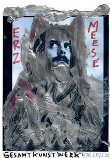
Jonathan Meese, GESAMTKUNSTWERKERZMUSIKUSS CLOCKWORK DE LARGE! NUR LIEBE MUSIZIERT ZUKUNFT, Serie 8, 2024 © Bildrecht, Wien 2024