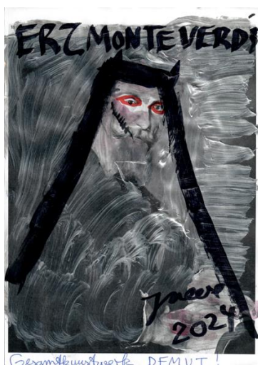
Jonathan Meese, GESAMTKUNSTWERKERZMUSIKUSS CLOCKWORK DE LARGE! NUR LIEBE MUSIZIERT ZUKUNFT, Serie 9, 2024 © Bildrecht, Wien 2024