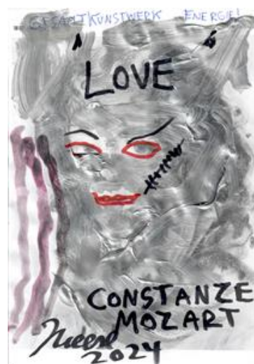
Jonathan Meese, GESAMTKUNSTWERKERZMUSIKUSS CLOCKWORK DE LARGE! NUR LIEBE MUSIZIERT ZUKUNFT, Serie 1, 2024 © Bildrecht, Wien 2024

Die Bilder können Sie hier downloaden: https://mozarteum.at/presse