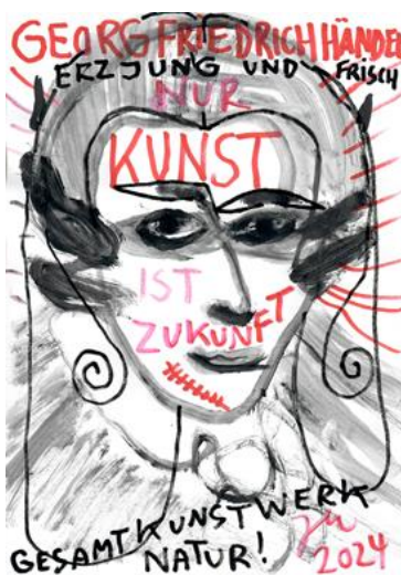
Jonathan Meese, GESAMTKUNSTWERKERZMUSIKUSS CLOCKWORK DE LARGE! NUR LIEBE MUSIZIERT ZUKUNFT, Serie 14, 2024 © Bildrecht, Wien 2024