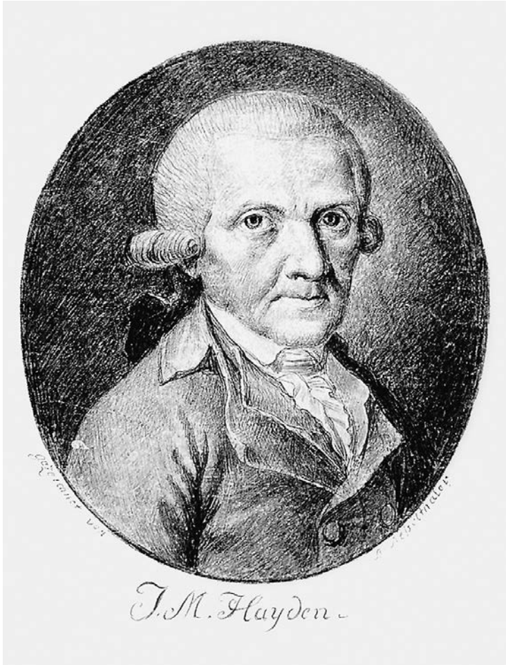
Johann Michael Haydn. Bleistiftzeichnung von Andreas Nesselthaler (1748–1821) für eine offensichtlich nicht ausgeführte Lithographie, um 1800. Privatbesitz